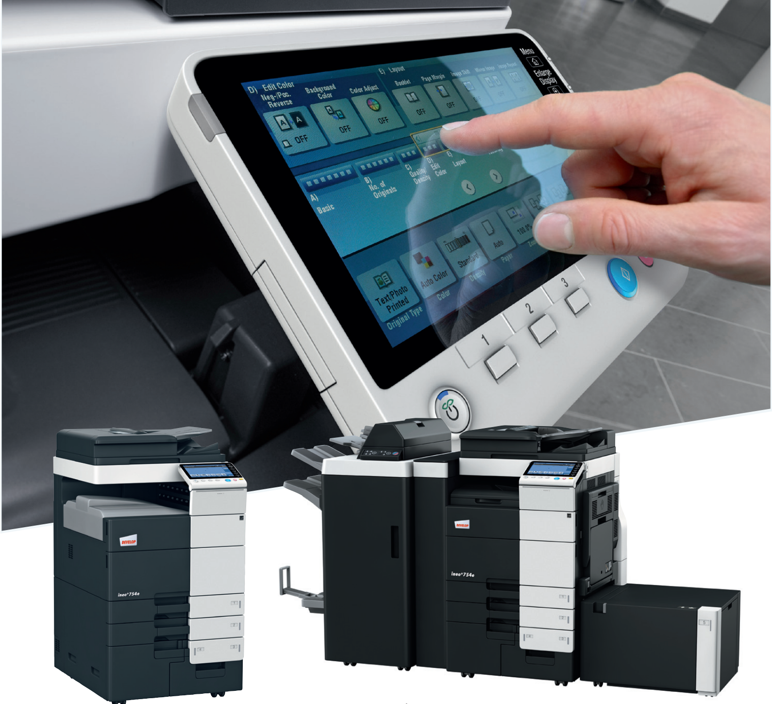
ineo+754e con vassoio uscita copie (OT-503)